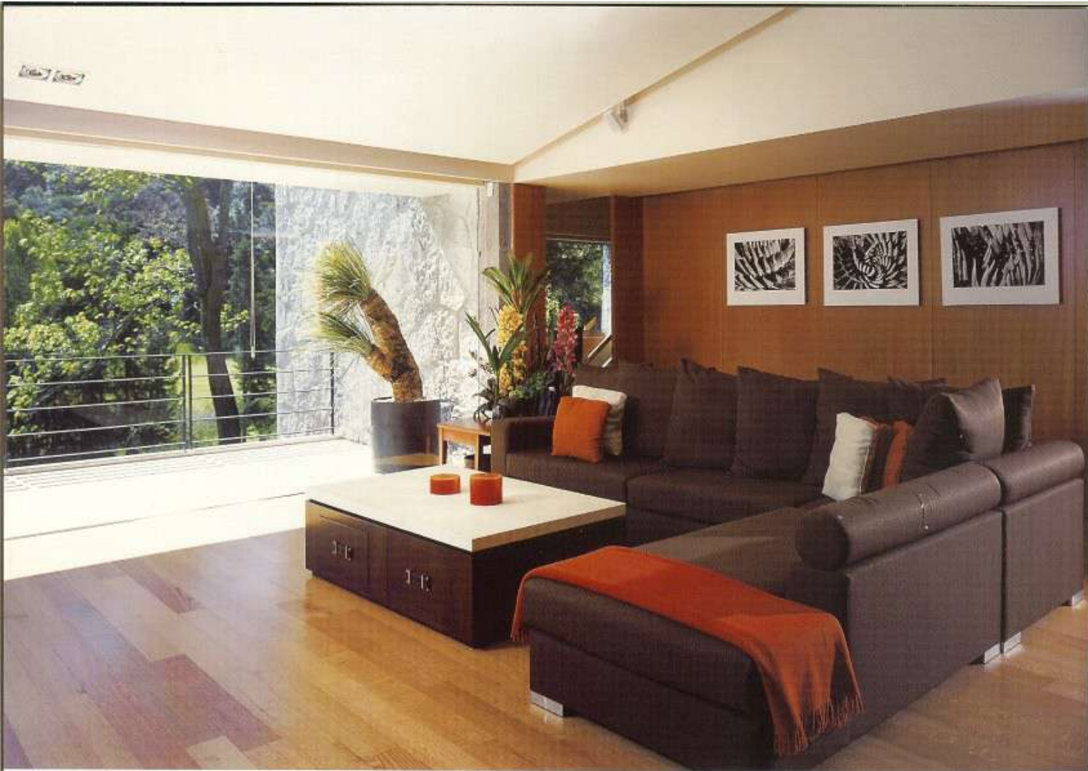
p.p. 105 a 111 Casa Bosques de Santa Fe, México, D.F.

En sus obras más recientes, Gerardo García ha tenido la oportunidad de abundar en el tema del espacio habitacional, mismo género que ha sido representativo de su trayectoria. Sin ceder el rol del espacio como protagonista, el arquitecto manipula las formas donde el usuario interactúa desde el aspecto funcional. El componente formal de su obra reciente se ha caracterizado por la inclusión de nuevos materiales en combinaciones y usos no convencionales, que agregan un componente de versatilidad al espacio. El uso de complementos como iluminación, mobiliario y accesorios sigue funcionando como el aspecto catalizador de esta nueva manera de aproximarse al proyecto.