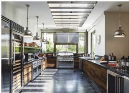
Los propietarios gustan de hacer reuniones, por lo que se decidió crear una cocina integrada al comedor que posee cuatro mesas y una sala de gran formato, espacio perfectamente conectado al garage. Esto permite una circulación en complicaciones en un entorno moderno, espacioso y elegante donde se garantiza la comodidad.